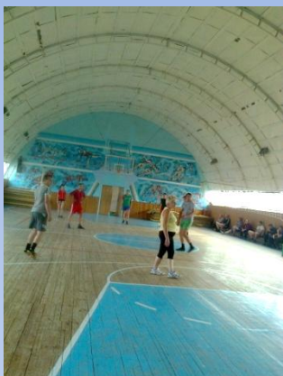
пер-во завода по волейболу