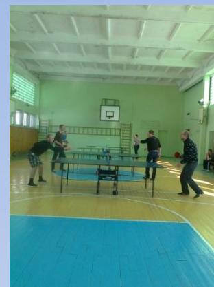
пер-во завода по настольному теннису