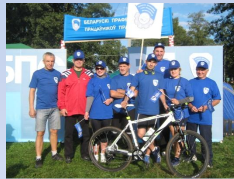
Рэспубліканскі турыстычны слет работнікаў федэрацыі прафсаюзаў Беларусі