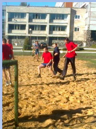
пер-во завода по мини-футболу